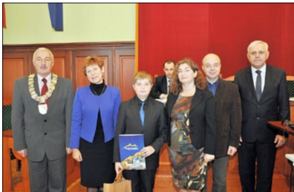
Listopadową sesję rozpoczęto od gratulacji dla stypendysty programu „zDolny Śląsk” i kolarzy LKS Atom Boxmet Dzierżoniów

Zawodnicy i trenerzy LKS-u Atom są częstymi gośćmi na sesjach RM. To za sprawą osiągniętych przez klub wyników. Również w tym roku nasze kolarki i kolarze zajęły pierwsze miejsce