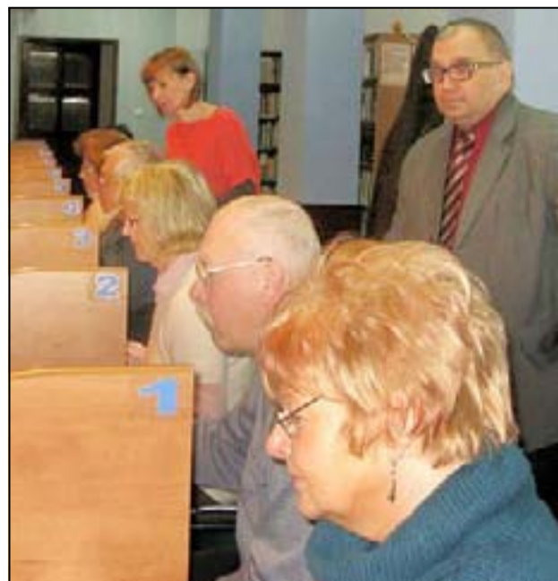
Kolejnych 15 osób rozpoczęło niedawno zajęcia dla osób 50+

Coraz większym zainteresowaniem cieszą się kursy obsługi komputera organizowane przez dzierżoniowską bibliotekę. Kolejnych 15 osób rozpoczęło niedawno zajęcia dla osób 50+. Czym komputery przyciągają seniorów?