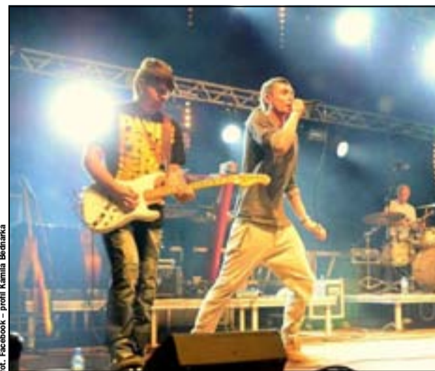
Jedną z gwiazd, która wystąpi na tegorocznym święcie miasta, będzie Kamil Bednarek

O wydarzeniach organizowanych w tym roku można przeczytać w zakładce „Kultura” na www.dzierżoniow.pl . Tutaj również dostępne są galerie zdjęć m.in. z ubiegłorocznych koncertów.