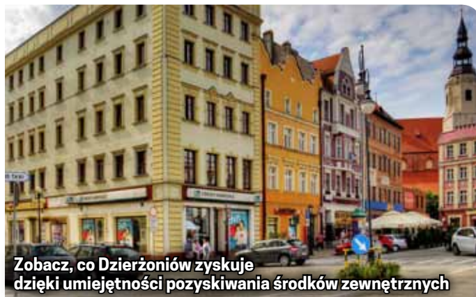
Zobacz, co Dzierżoniów zyskuje dzięki umiejętności pozyskiwania środków zewnętrznych

bytych do tej pory środków miasto zdobyło na budowę centrum przesiadkowego. Oprócz pieniędzy zdobywanych przez urząd środki z zewnątrz spływają także do Dzierżoniowa dzięki działalności Stowarzyszenia Ziemia Dzierżoniowska.