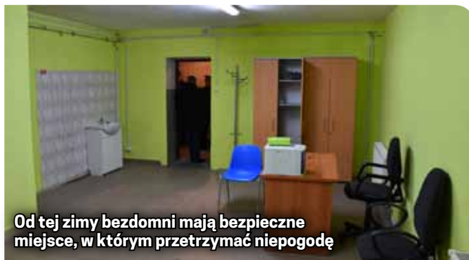
Od tej zimy bezdomni mają bezpieczne miejsce, w którym przetrzymać niepogodę

- Jej utworzenie jest również szansą na częstszy kontakt bezdomnych z osobami zajmującymi się udzielaniem pomocy i być może w niektórych przypad-