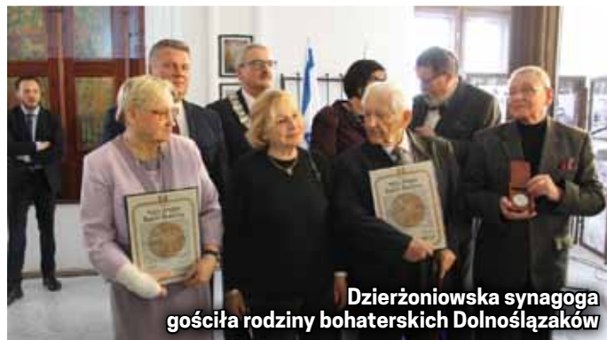
Dzierżoniowska synagoga gościła rodziny bohaterskich Dolnoślązaków