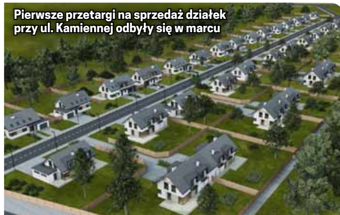
Pierwsze przetargi na sprzedaż działek przy ul. Kamiennej odbyły się w marcu

Coraz większym zainteresowaniem cieszy się tak-