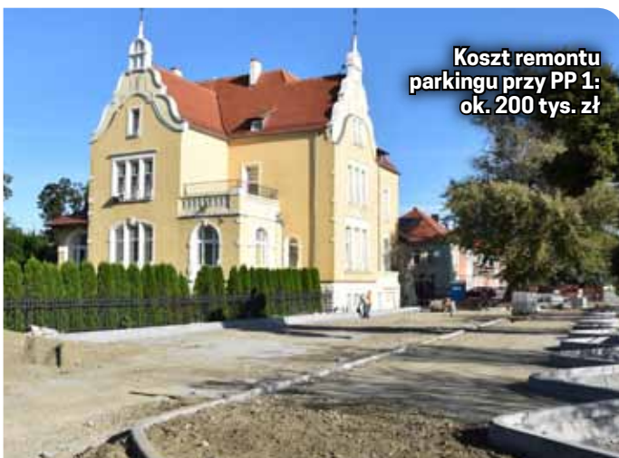
Koszt remontu parkingu przy PP 1: ok. 200 tys. zł

mała architektura. Na miejsce wrócił obelisk poświęcony Januszowi Kusocińskiemu. Będzie też Aleja Dzierżoniowskich Sportowców.