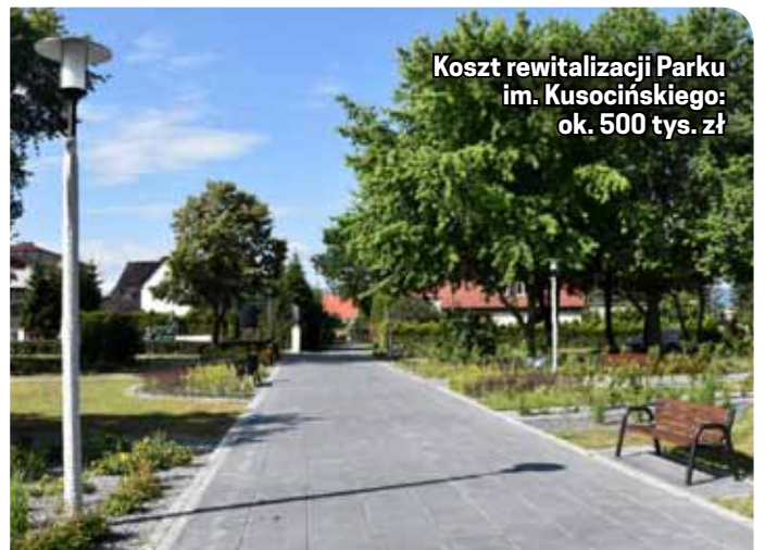
Koszt rewitalizacji Parku im. Kusocińskiego: ok. 500 tys. zł