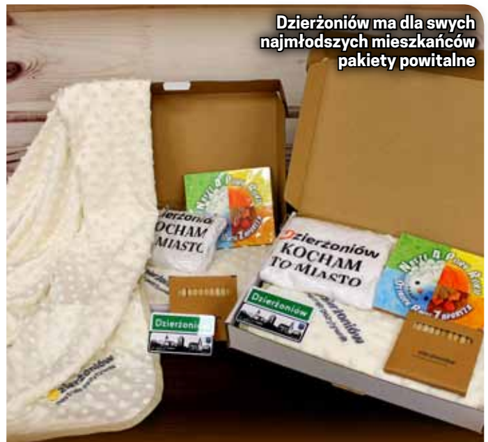
Dzierżoniów ma dla swych najmłodszych mieszkańców pakiety powitalne

Zainteresowanych rodziców prosimy o kontakt z Biurem Promocji, tel. 074 645 04 01, e-mail: promocja@um.dzierzoniow.pl