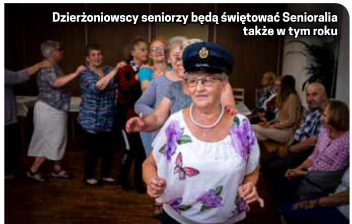
Dzierżoniowscy seniorzy będą świętować Senioralia także w tym roku

ludzkich, sprzętu ortopedycznego itp., a nie używają go, bo nie mają takiej potrzeby, będą mogli podzielić się nim z tymi, którym jest on niezbędny, i którym utatwi on funkcjonowanie na co dzień.