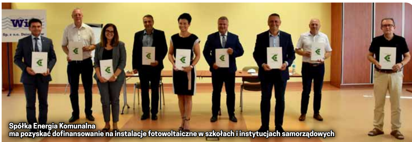
Spółka Energia Komunalna ma pozyskać dofinansowanie na instalacje fotowoltaiczne w szkołach i instytucjach samorządowych

ski, burmistrz Dzierżoniowa. Oprócz realizacji samego projektu Bielawa, Pieszyc i gmina Dzierżoniów wyraziły także chęć przystąpienia do spółki Energia Komunalna, która w energetyce będzie pełnić podobną rolę jak WIK (spółka gminna zajmująca się gospodarką wodno-ściekową).