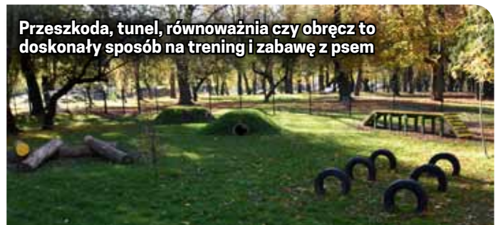
Przeszkoda, tunel, równoważnia czy obręcz to doskonały sposób na trening i zabawę z psem

Plac zabaw tworzy strefa wejściowa i dwie duże, oddzielone przestrzenie dla małych i większych psów.