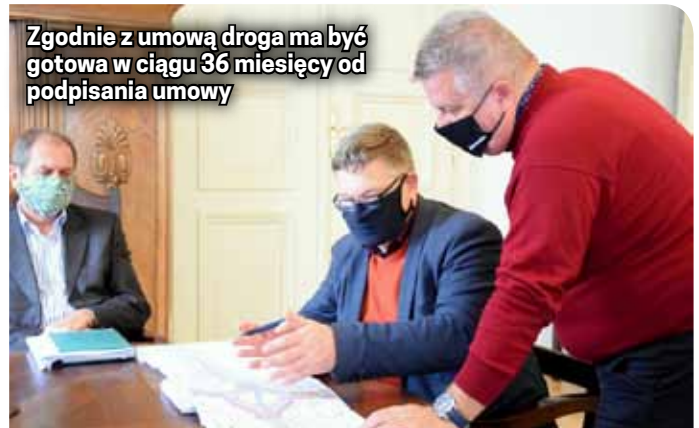
Zgodnie z umową droga ma być gotowa w ciągu 36 miesięcy od podpisania umowy

Wykonawca obecnie przygotowuje dokumentację techniczną i przeprojektowuje trasę na odcinku od ronda na drodze Dzierżoniów - Pieszycy do skrzyżowania z linią kolejową w Bielawie. Zmienia