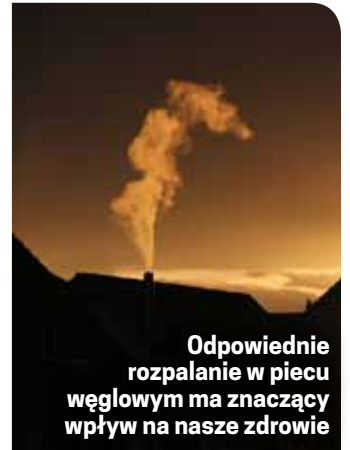
Odpowiednie rozpalanie w piecu węglowym ma znaczący wpływ na nasze zdrowie

w cudowny sposób one znikają. Co więcej – to, co z pieca wydostaje się do mieszkania, pomimo że niewidoczne, jest również bardzo szkodliwe. Kluczowe znaczenie ma również jakość węgla, którym palimy. Najlepiej sprawdzić to samemu. Porównaj, ile ciepła dostarcza najtańszy węgiel i jaka jest częstotliwość dokładania do pieca, z tym, jak wygląda to w przypadku węgla o wyższej kaloryczności.