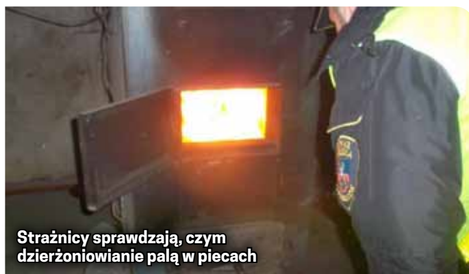
Strażnicy sprawdzają, czym dzierżoniowianie palą w piecach

Przypominamy, że funkcjonariusze Straży Miejskiej w Dzierżoniowie są upoważnieni do kontroli posesji na terenie miasta, a jej uniemożli-