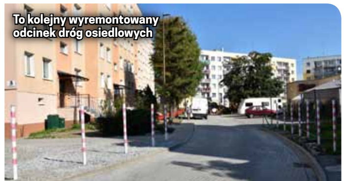
To kolejny wyremontowany odcinek dróg osiedlowych

i 11) i dotyczyły budowy kanalizacji deszczowej, budowy nowego oświetlenia i przebudowy drogi, którą wyłożono kostką. Roboty budowlane o wartości 556 tys. zł zrealizowała dzierżoniowska firma wyłoniona w przetargu.