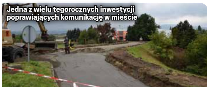
Jedna z wielu tegorocznych inwestycji poprawiających komunikację w mieście

oświetlenie, wymienione też zostaną barierki ochronne. Planowany termin zakończenia prac to koniec listopada.