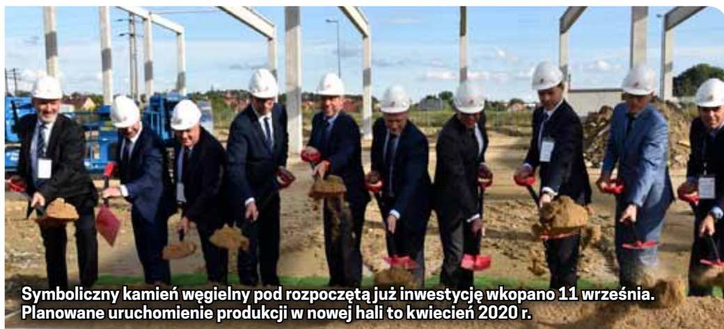
Symboliczny kamień węgielny pod rozpoczętą już inwestycję wkopano 11 września. Planowane uruchomienie produkcji w nowej hali to kwiecień 2020 r.