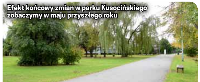
Efekt końcowy zmian w parku Kusocińskiego zobaczymy w maju przyszłego roku

nasadzenia. Na terenie parku powstaną specjalne „kwatery” dla kwiatów i krzewów. W ramach kosztujących 498 tys. 991 zł prac wyremontowana zostanie główna aleja pomiędzy ulicami Piastowską i Świdnicką, na której powstanie „Aleja Gwiazd Dzierżoniowskich Sportowców”.