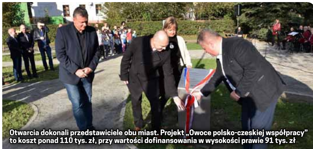
Otwarcia dokonali przedstawiciele obu miast. Projekt „Owoce polsko-czeskiej współpracy” to koszt ponad 110 tys. zł, przy wartości dofinansowania w wysokości prawie 91 tys. zł

20 drzew i 50 krzewów zostało posadzonych wzdłuż ul. Kopernika przy rzece Piławie w pobliżu Skweru Juniora i Seniora w ramach projektu „Owoce polsko-czeskiej współpracy” współfinansowanego z Unii Europejskiej oraz Europejskiego Funduszu Rozwoju Regionalnego, a także budżetu państwa za pośrednictwem Euroregionu Glacensis. Zadanie zainaugurowano w maju podczas wizyty gości z Czech, zakończono zaś w październiku. Przy roślinach stanęły grawerowane tabliczki ze stali nierdzewnej z ich nazwami i ciekawostkami na temat owoców lub przepisami – oczywiście po polsku i po czesku. Do Owocowego Skweru prowadzi wygodna szutrowa ścieżka z oświetleniem. Na same owoce będziemy musieli trochę poczekać, ale miejmy nadzieję, że jak już zaowocują, to obficie. Mieszkańcy będą więc mogli korzystać z owoców współpracy polsko-czeskiej także dostawnie. A że nasza współpraca kwitnie, miejsce to z pewnością będą odwiedzać uczniowie nie tylko z pobliskiej SP nr 9, ale również