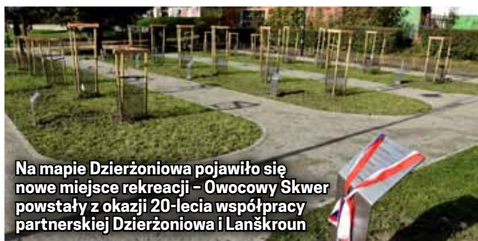
Na mapie Dzierżoniowa pojawiło się nowe miejsce rekreacji – Owocowy Skwer powstały z okazji 20-lecia współpracy partnerskiej Dzierżoniowa i Lanškroun

anse - „Sklep przy głównej ulicy”,- „Adela jeszcze nie jadła kolacji” i „Ikaria XB1”. 28 października podczas uroczystej części sesji Rady Miejskiej Dzierżoniowa starosta Lanškroun Radim Vetchý odebrał Medal za Zastugi