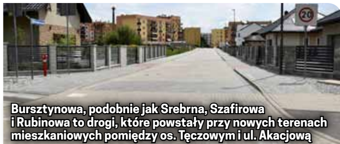
Bursztynowa, podobnie jak Srebrna, Szafirowa i Rubinowa to drogi, które powstały przy nowych terenach mieszkaniowych pomiędzy os. Tęczowym i ul. Akacją