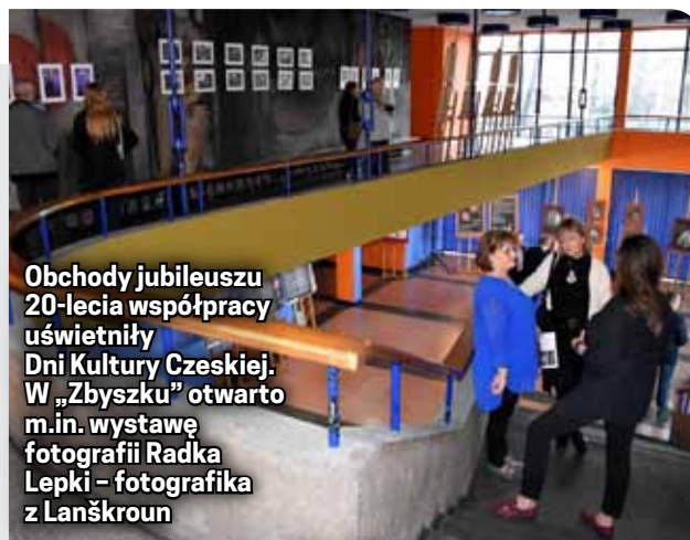
Obchody jubileuszu 20-lecia współpracy uświetniły Dni Kultury Czeskiej. W „Zbyszku” otwarto m.in. wystawę fotografii Radka Lepki - fotografika z Lanškroun

skich muzyków. To efekt projektu artystycznego realizowanego wspólnie z partnerskim Lanškroun.