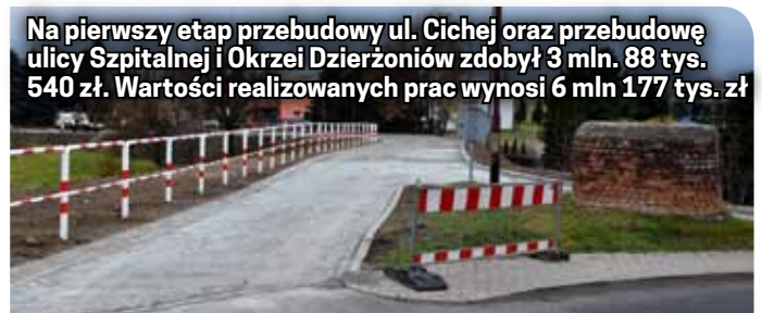
Na pierwszy etap przebudowy ul. Cichej oraz przebudowę ulicy Szpitalnej i Okrzei Dzierżoniów zdobył 3 mln. 88 tys. 540 zł. Wartości realizowanych prac wynosi 6 mln 177 tys. zł

żoniowa 1 mln 641 tys. zł. Również 70% dofinansowania Dzierżoniów zdobył na drugi etap przebudowy ul. Cichej. To zadanie będzie kosztowało 5 mln 375 tys. 344 zł, a wysokość zdobytych środków zewnętrznych to kwota 3 mln 762 tys. 741 zł.