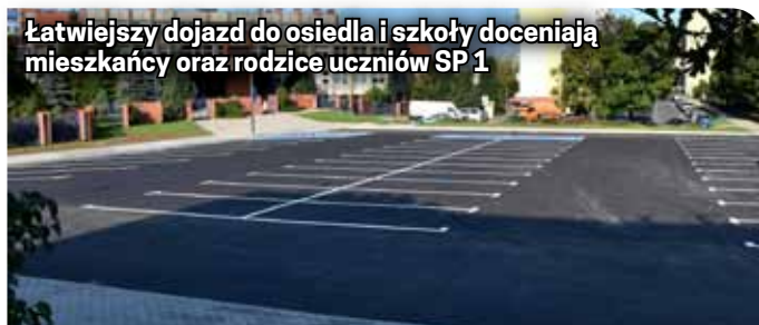
Łatwiejszy dojazd do osiedla i szkoły doceniają mieszkańcy oraz rodzice uczniów SP 1

kosztowały 1 mln 220 tys. zł. Nawierzchnia z kostki, chodniki, oświetlenie ledowe - to natomiast efekty budowy ul. Bursztynowej - drogi, która połączyła os. Tęczowe z ul. Akacją. Dodatkowy wjazd na nową część os. Tęczowego ułatwia kierowcom poruszanie się w tamtej części miasta.