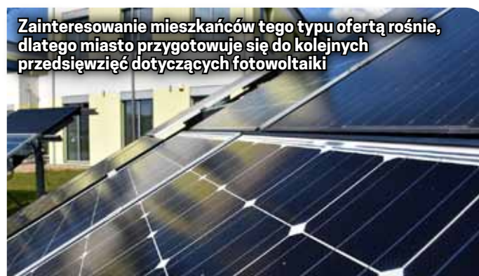
Zainteresowanie mieszkańców tego typu ofertą rośnie, dlatego miasto przygotowuje się do kolejnych przedsięwzięć dotyczących fotowoltaiki

Drugi aspekt pracy pełnomocnika dotyczy estetyki. Już w przyszłym roku miasto, w oparciu o wskazania i propozycje mieszkańców, rozpocznie realizację dużego programu, w ramach którego drobne prace i remonty poprawiające funkcjonalność oraz wygląd przestrzeni publicznej będą wykonywane wspólnie z mieszkańcami.