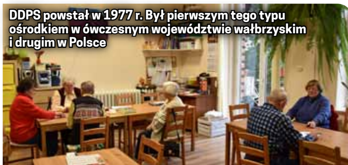
DDPS powstał w 1977 r. Był pierwszym tego typu ośrodkiem w ówczesnym województwie wałbrzyskim i drugim w Polsce

- Najkrócej mówiąc zajmujemy się opieką osób starszych. Angażujemy seniorów w życie społeczne miasta, oferujemy m.in. możliwość oderwania się od codziennej rutyny. Tu mogą się spotykać, uczestniczyć w terapiach zajęciowych, zabawach, wycieczkach i spotkaniach. Ważnym aspektem działalności jest możliwość poprawy zdrowia poprzez rehabilitację. Pomagamy także w załatwianiu spraw, które