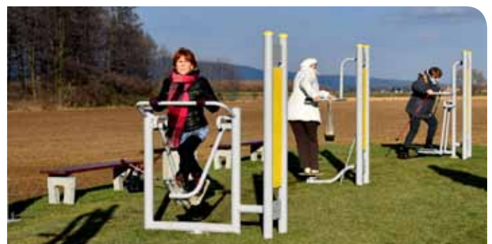
Dzierżoniów zachęca mieszkańców do aktywnego trybu życia

Inwestycja kosztowała 102 tys. 400 zł. Na jej wykonanie miasto przeznaczyło 76 tys. 395 zł z budżetu, 20 tys. 705 zł pochodzi z tegorocznej loterii Smok Publiczności zorganizowanej podczas Dzierżoniowskich Prezentacji, a 5 tys. 300 zł przekazała Wałbrzyska Specjalna Strefa Ekonomiczna w formie sponsoringu.