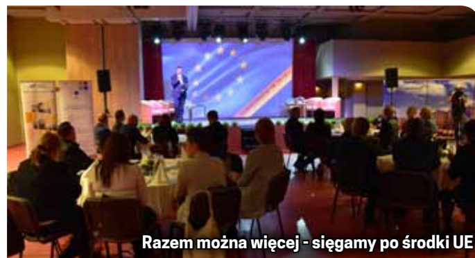
Razem można więcej - sięgamy po środki UE

Głównym celem konferencji zorganizowanej przez Stowarzyszenie Ziemia Dzierżoniowska i Urząd Miasta w Dzierżoniowie było omówienie przebiegu dotychcza-