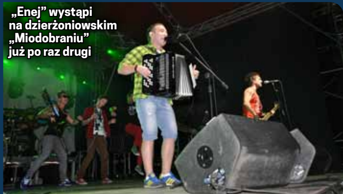
„Enej” wystąpi na dzierżoniowskim „Miodobranu” już po raz drugi