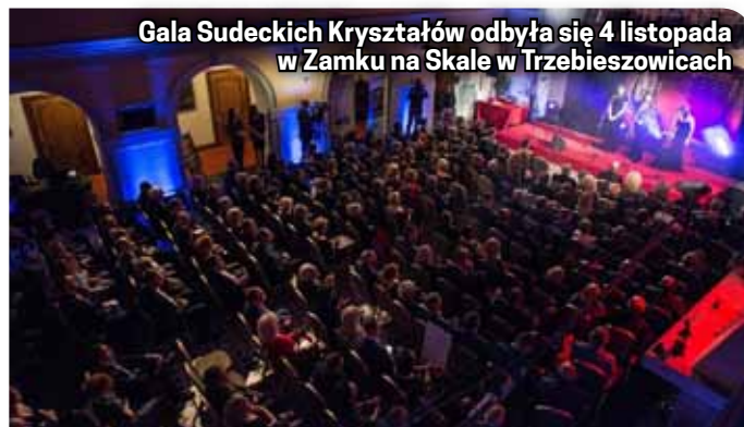
Gala Sudeckich Kryształów odbyła się 4 listopada w Zamku na Skale w Trzebieżowicach

W ostatniej kategorii, w której oceny dokonywała kapituła konkursowa Sudecki Kryształ za „Najlepszą Imprezę Promującą Region” otrzymały Dzierżoniowskie