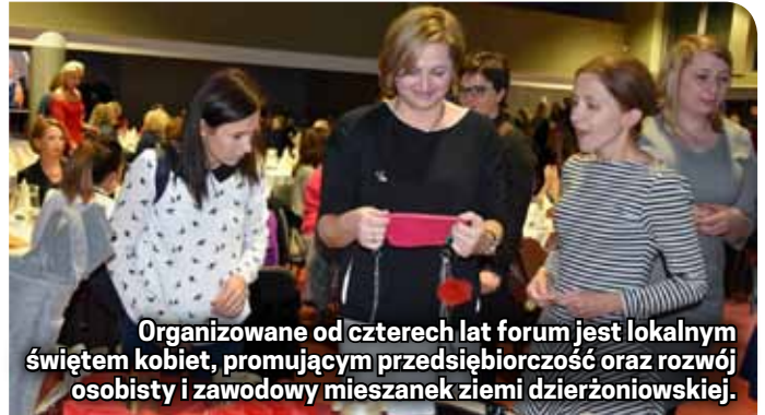
Organizowane od czterech lat forum jest lokalnym świętem kobiet, promującym przedsiębiorczość oraz rozwój osobisty i zawodowy mieszanek ziemi dzierżoniowskiej.

na rok przyciąga coraz więcej uczestniczek z całego regionu. Jest okazją do