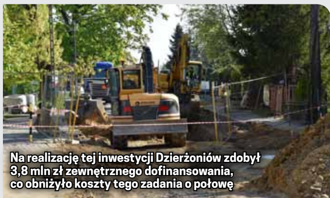
Na realizację tej inwestycji Dzierżoniów zdobył 3,8 mln zł zewnętrznego dofinansowania, co obniżyło koszty tego zadania o połowę

Efektom tego zadania będą kompleksowo przebudowane drogi, wraz z całą infrastrukturą, tj: Chodnikami, ścieżkami rowerowymi, miejscami parkingowymi i oświetleniem ledowym. Koszt tego zadania to 6 mln 142 tys. 620 zł. Planowany termin zakończenia to koniec października.