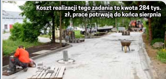
Koszt realizacji tego zadania to kwota 284 tys. zł, prace potrwać do końca sierpnia

Zakres prac obejmuje wykonanie odwodnienia i przebudowę drogi, wjazdów i chodników z nawierzchni z kostki betonowej oraz montaż oświetlenia ledowego. Ta inwestycja miasta wykonywana jest wspólnie ze spółdzielnią. Wkładem spółdzielni jest remont dojeżdż do budynków nr 13 i 12 i kilku istniejących miejsc parkingowych.