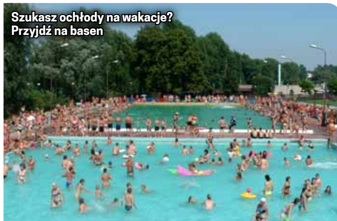
Szukasz ochłody na wakacje? Przyjdź na basen

Ceny biletów na basen nie uległy zmianie. Bilet normalny kosztuje 5 zł, ulgowy - 3 zł.