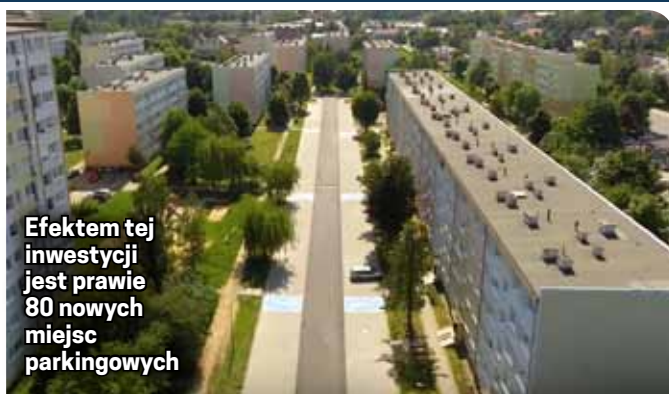
Efektom tej inwestycji jest prawie 80 nowych miejsc parkingowych

Droga prowadząca od ul. Sikorskiego wzdłuż bloku nr 1 ma szczególne znaczenie, ponieważ jest jedną z dwóch, którą wjedziemy na os. Jasne. Jej przebudowa zlikwidowała występujący tu często problem jeżdżenia „na zakładkę”. Ustalone z mieszkańcami budynku nr 1 zmiany polegały na remoncie drogi i zastąpieniu chodnika nowymi miejscami parkingowymi. W ramach współpracy miasta i spółdzielni z budżetu spółdzielni sfinansowano budowę 27 nowych miejsc parkingowych. Koszt inwestycji po stronie miasta to 1 mln 59 tys. zł.