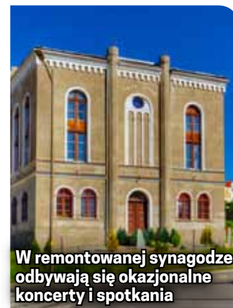
W remontowanej synagodze odbywają się okazjonalne koncerty i spotkania

W związku z trwającymi pracami remontowymi godziny otwarcia synagogi nie są stałe. Osoby zainteresowane zwiedzaniem uprzejmie prosimy o wcześniejszy kontakt e-mailowy na adres: dorinbl@gmail.com .