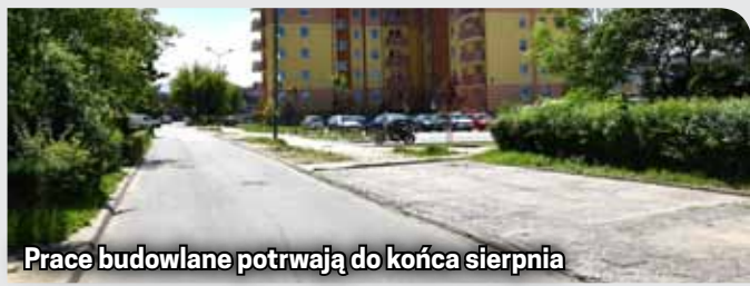
Prace budowlane potrwać do końca sierpnia

Około 40 miejsc parkingowych zostanie wyznaczonych wzdłuż przebudowanego i poszerzonego łącznika. Koszt inwestycji to kwota 1 mln 220 tys. zł.