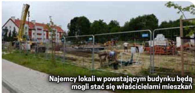
Najemcy lokali w powstającym budynku będą mogli stać się właścicielami mieszkań

Nowy budynek będzie miał powierzchnię użytkową 2.641,85 m 2 . Znajdzie się w nim 31 lokali mieszkalnych, w tym mieszkania jednopokojowe (40,39 m 2 ), dwupokojowe (55,93 m 2 ), i trzypokojowe (65,78 m 2 i 66,33 m 2 ). Będzie też winda i hala garażowa. Koszt inwestycji to 8 mln 332 tys. zł. Jej zakończenie planowane jest w kwietniu przyszłego roku.