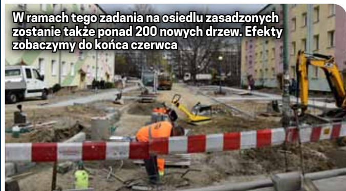
W ramach tego zadania na osiedlu zasadzonych zostanie także ponad 200 nowych drzew. Efekty zobaczymy do końca czerwca

W tym roku powstaje prawie 200 nowych miejsc parkingowych, nowe drogi komunikacyjne, w tym wyjazd z osiedla w ul. Piastowską. Koszt realizowanych w tym etapie prac to kwota 2 mln 898 tys. zł, całkowity koszt pierwszego etapu to 3 mln 700 tys. zł.