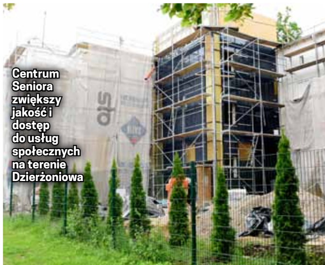
Centrum Seniora zwiększy jakość i dostęp do usług społecznych na terenie Dzierżoniowa

Pensjonariusze zyskają ogrodzony, zagospodarowany w zieleni i drobną architekturę teren, urządzenia relaksacyjne, a także nowe wyposażenie wspomagające proces terapeutyczny. Koszt robót budowlanych - 2018 r. - 3 mln 269 tys. zł, 2019 r. - 4 mln 711 tys. zł. Planowany termin oddania obiektu do użytku to październik 2019 r.