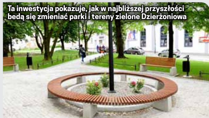
Ta inwestycja pokazuje, jak w najbliższej przyszłości będą się zmieniać parki i tereny zielone Dzierżoniowa

Na skwerze pomiędzy ul. Wrocławską, Piastowską i Strzelniczą wykonano prace poprawiające funkcjonalność i estetykę tego miejsca. Inwestycja kosztowała 245 tys. zł i w ramach tej kwoty powstały nowe alejki, oświetlenie, mała architektura (ławki, stojaki na rowery, kosze na śmieci) oraz zagospodarowano zieleni. Jej zakończenie planowane jest w kwietniu przyszłego roku.