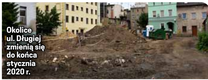
Okolice ul. Długiej zmieniają się do końca stycznia 2020 r.

Rozbiórka istniejących i budowa nowych komórek gospodarczych, budowa ciągów pieszo-jezdnych, miejsc parkingowych i boksów na odpady komunalne zmieni estetykę podwórek w staromiejskim centrum. Koszt tej inwestycji to kwota 778 tys. zł.