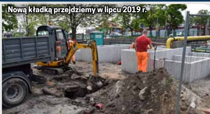
Nową kładką przejdziemy w lipcu 2019 r.

Nowa kładka powstaje dokładnie w tym samym miejscu. Przy okazji jej budowy znikną utrudnienia dla osób mających problemy z poruszaniem, rowerzystów i rodziców spacerujących z dziećmi w wózkach. Koszt tej inwestycji zamknie się kwotą miliona złotych.