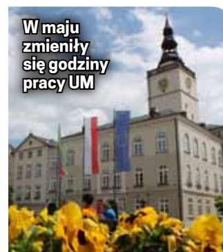
W maju zmieniły się godziny pracy UM

Burmistrz przyjmuje zaś mieszkańców we wtorki w godz. 13.30-16.30.