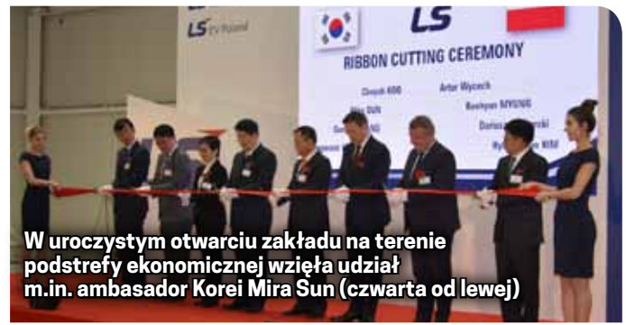
W uroczystym otwarciu zakładu na terenie podstrefy ekonomicznej wzięła udział m.in. ambasador Korei Mira Sun (czwarta od lewej)

produkcyjnych: LS EV Poland i LS Cable & System Poland. LS EV produkuje podzespoły do baterii dla samochodów elektrycznych, a LS Cable & System - kable światłowodowe. Dla grupy LS fabryka w Dzierżoniowie jest piątą tego rodzaju zagraniczną inwestycją