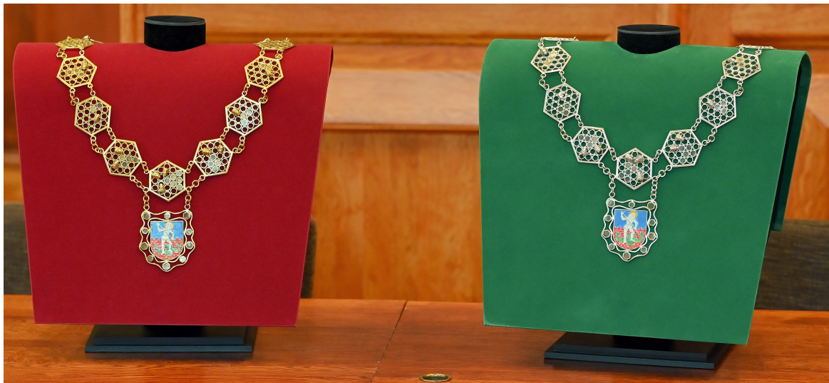
Po lewej stronie łańcuch burmistrza, po prawej przewodniczącego rady