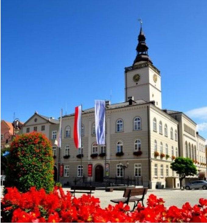
Odwiedzając Dzierżoniów i Centrum

Informacji Turystycznej można zwiedzić i wspiać się na średniowieczną wieżę ratuszową. Zbudowana jest ona na planie kwadratu, do której wnętrza prowadzą dwa wejścia ozdobione ostrołukowymi ceglanyimi portalami.