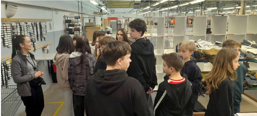
Uczniowie jednej ze szkół podstawowych z wizytą w firmie Zebra.

W 2025 r. dzięki zaangażowaniu dzierzoniowskich przedsiębiorców udało się zrealizować 64 lekcje przedsiębiorczości dla blisko 1.500 uczniów. Była to bezcenna szansa dla dzieci na zdobycie wiedzy praktycznej, poznanie realiów prowadzenia firmy oraz zainspirowanie się historiami lokalnych biznesów.